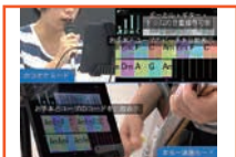
市販楽曲中のボーカル・ギター・ドラムを調節可能なカラオケ・楽器演奏アプリ

京都大学における情報通信技術 (ICT) を公開し、産官学連携を促進するためのイベントです。情報学研究科・学術情報メディアセンター・デザイン学大学院連携プログラムで研究開発されたソフトウェア、コンテンツなどを一挙にご覧いただけます。