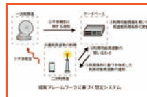
5Gに向けたデータベース支援型周波数共有のための共用条件の更新