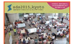
サマーデザインスクール 2015