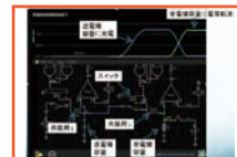
電力パケット配送プロトコルの設計