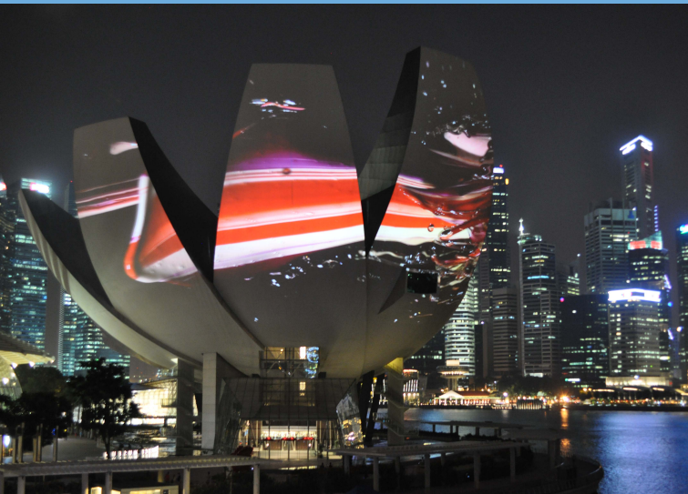
シンガポールマリナベイサンズの アートサイエンスミュージアムの例