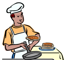
パンケーキの焼き方