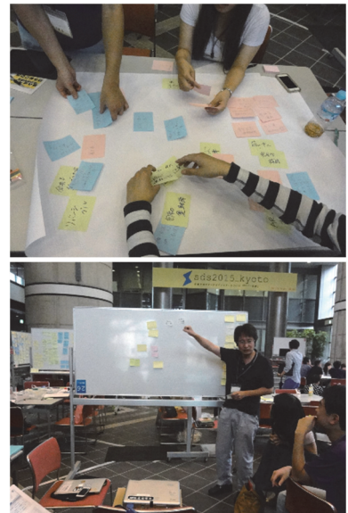
pic.1 アイデア出し(上図)とプレゼンテーションバトル(下図)

プレストバトルで出たアイデアをtab.1に記す。左端に投票結果を示しており、このバトルではAチーム1勝、Bチーム2勝ということでBチームの勝利となった。また、それぞれのバトルで勝利した三つのアイデアを対象に決戦投票を行った結果、『似顔絵車』が最優秀アイデアに選出された。普段より自動車に関連した研究や仕事に従事しているテーマ実施者たち