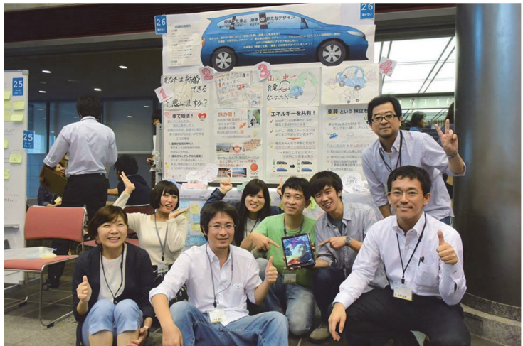
pic.4 最終日のリフレクション後にポスター前に集合したテーマ参加者と実施者