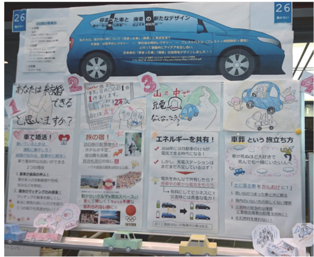
pic.2 最終日に展示したポスター

ポスターのタイトルは「 停まった車と廃車の新たなデザイン 」と決定し、四つのアイデアを紹介する内容となっている。これらは、『2020年／2030年の動かないクルマ』で出たアイデアだけでなく、初日にブレストバトルの練習を兼ねて実施した『2030年のおもしろいクルマ』で出たアイデアも取り入れつつ、複数のアイデアを組み合わせたものとなった。